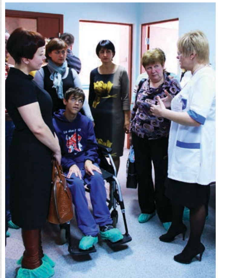
В центре открыты специальные курсы, на которых учат приемам ухода за больным, оказывают психологическую помощь членам семьи