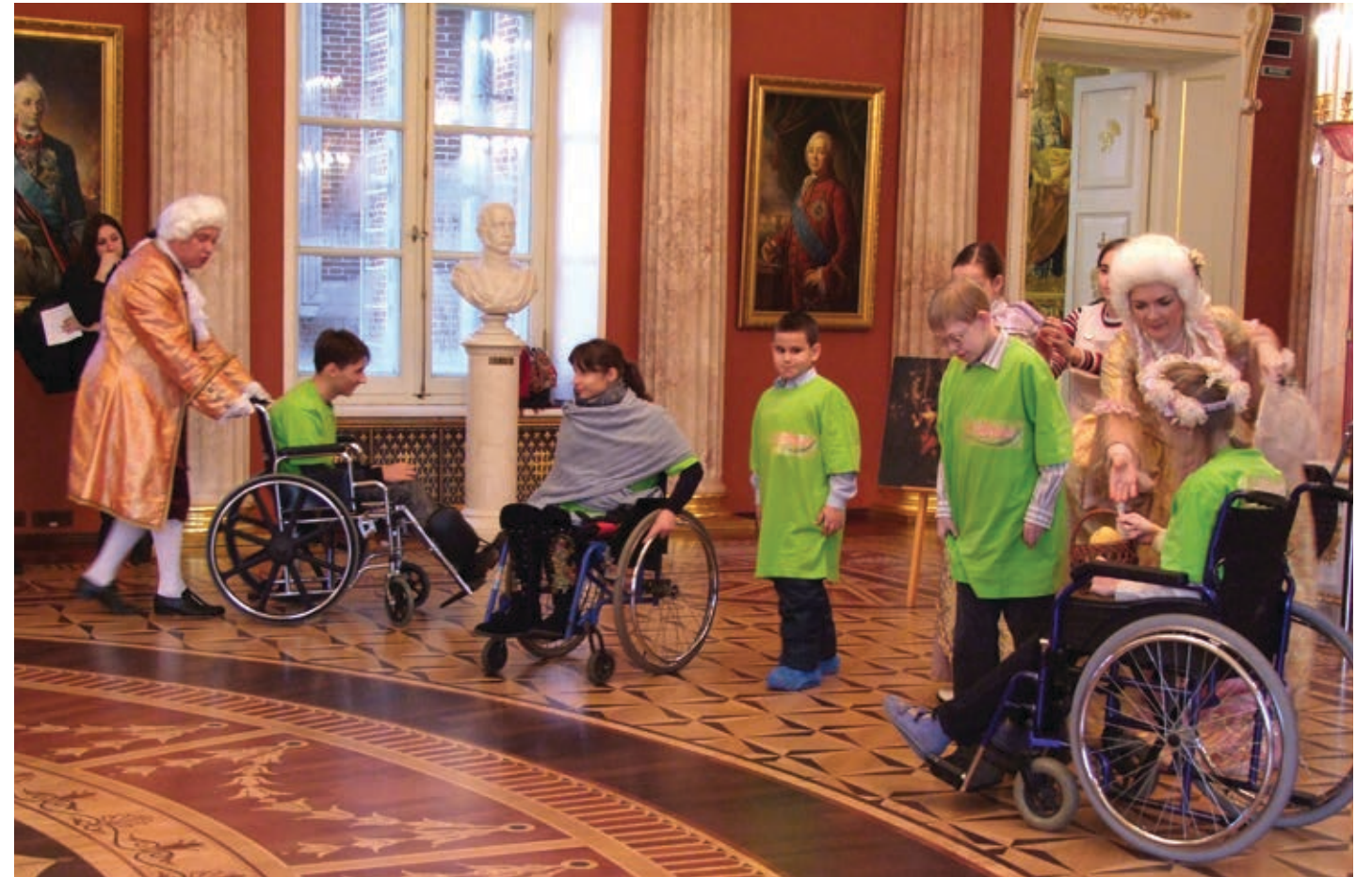
Сотрудники музея всегда готовы оказать помощь тем, кто в ней нуждается

ЗДЕСЬ ПОСТОЯННО ВЕДЕТСЯ РАБОТА ПО СОЗДАНИЮ КОМФОРТНЫХ УСЛОВИЙ ПРЕБЫВАНИЯ ИНВАЛИДОВ