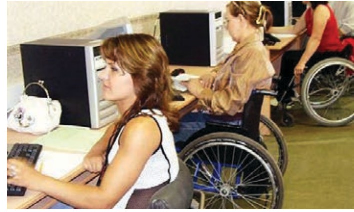
Студенты будут оказывать помощь людям с инвалидностью и их близким