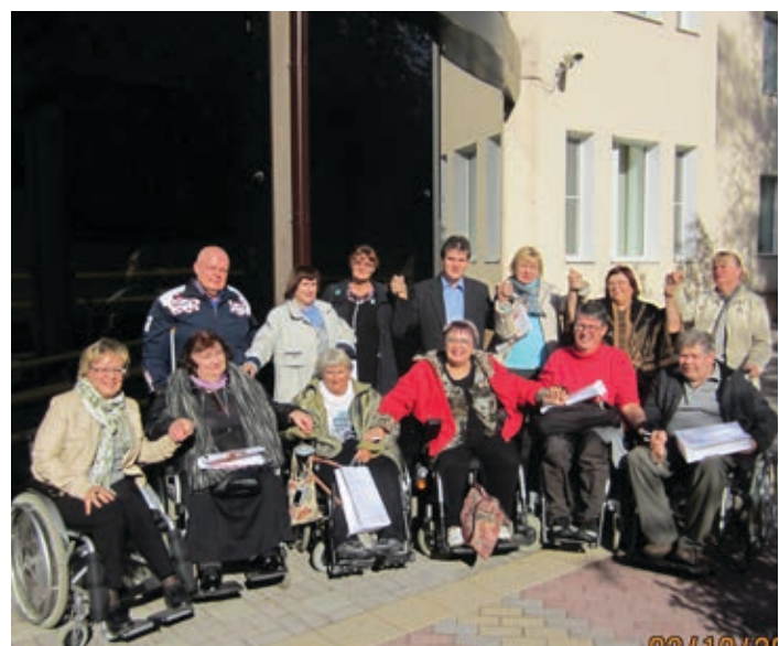
Москвичи и берлинцы сфотографировались на память

столы» для разработки путей решения общих проблем, касающихся людей с инвалидностью; осуществлять сотрудничество в области создания безбарьерной среды; способствовать развитию культурных связей, организовывать совместные мероприятия; обмениваться информацией о новинках в области технических средств реабилитации; информировать друг друга о службе социальных работников, о персональных помощниках; обсуждать проблемы трудоустройства, поднятия статуса людей с инвалидностью.