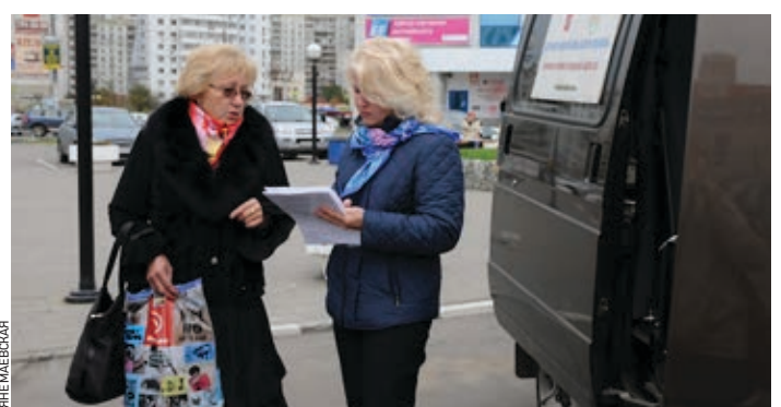
Сотрудники выслушают, посоветуют, помогут...

вернули на место! Причем знак как стоял, так и стоит. Каждый день звоню в управу, но ничего не меняется...» Как выяснилось, у этого дома стандартная московская проблема — пешеходный переход устроили в одном месте, а удобный путь для местных жителей пролетает совсем в другом. «Там, где переход, не пройти, — поясняет женщина. — Ходят все там, где проход между домами». Положение спасали «лежащие полицейские» — машинистам приходилось притормаживать. Сейчас они носятся с такой скоростью, что аж страшно становится! Время работы мобильной приемной заканчивается, сотрудники собирают заявления. Их, конечно, немного, но то внимание, с которым встречали каждого подошедшего к «Газели» человека — дорогого стоит. График работы Мобильной приемной социальной защиты размещен на сайте Департамента социальной защиты населения города Москвы dszn.ru, сайта управ и префектур, информационных стендах районов. Если вы увидите микроавтобус с надписью «Мобильная приемная социальной защиты», подходите, там вам обязательно помогут!