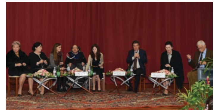
Встреча прошла в дружеской обстановке