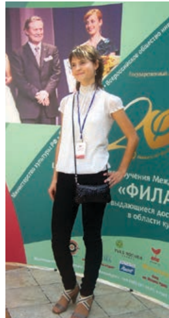
Лауреаты премии «Филантроп» разных лет: эти минуты триумфа останутся с ними на всю жизнь

Каждый из участников конкурса, даже если он не становится победителем, получает звание номинанта Международной премии «Филантроп» и соответствующий сертификат. Это свидетельство его победы, победы духа над всеми физическими и моральными преградами на жизненном пути.